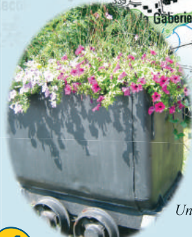
Un wagonnet de la mine