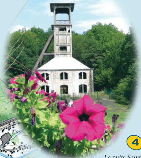
Le puits Sainte-Marie